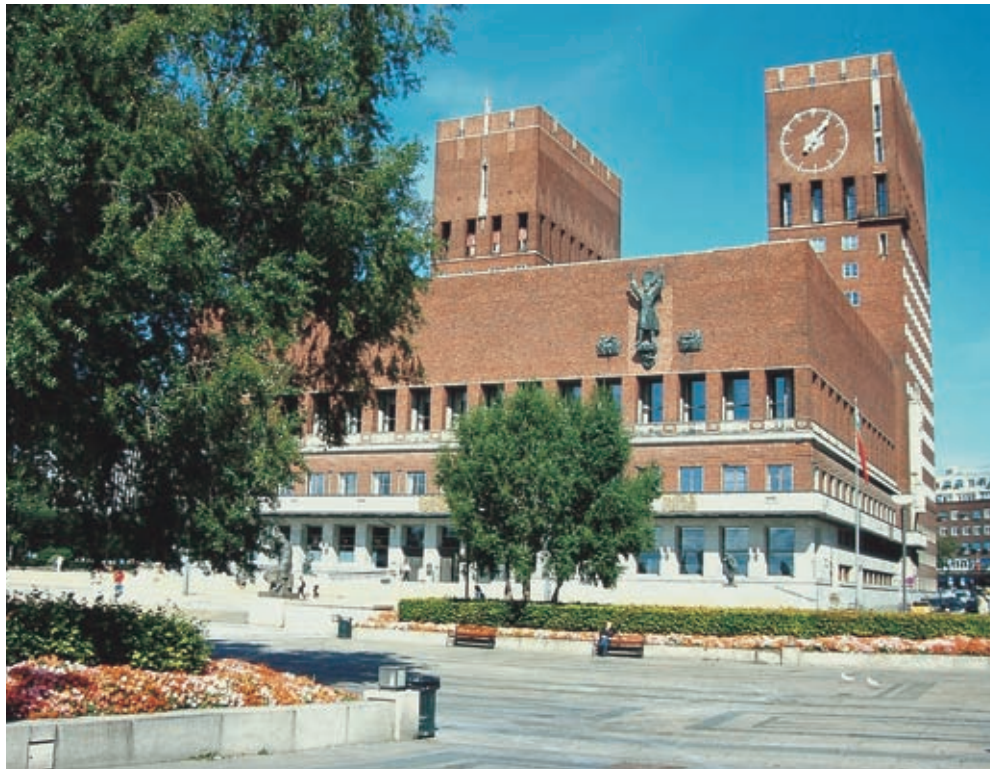
Il municipio di Oslo.

Piovigina e il cielo è finalmente grigio, con minacciosi nuvoloni che si agitano come accade spesso da queste parti, dove le