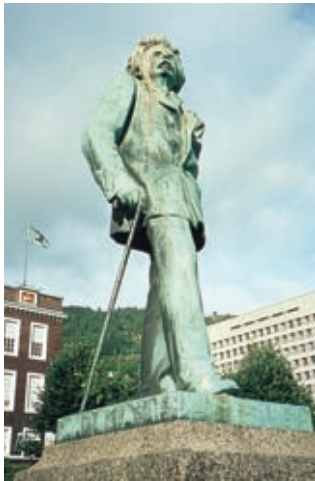
La statua di Edward Grieg a Bergen.

In verità è questa la terza volta che nell'arco di qualche decennio vengo in Norvegia ed è la terza volta che vi trovo il sole, che qui ha un potere assoluto, condizionando più che altrove la vita della gente in tutti i suoi aspetti e dando luogo, ad ogni apparizione che non sia fugace, a fenomeni di entusiasmo collettivo e di gioia che vanno al di là dell'immaginario almeno in coloro che con il sole hanno una consuetudine quasi quotidiana, come siamo noi mediterranei. Se poi capita qualche giorno consecutivo di sole, come in effetti mi è capitato anche questa volta, l'entusiasmo raggiunge livelli altissimi. Specie nelle città c'è allora il rischio che la vita e le cose di tutti i giorni si fermino e che coloro che hanno preso impegni particolari li rimandino a data da destinarsi preferendo disdirli piuttosto che rinunciare a mettersi a torso nudo da qualche parte nella speranza di accumulare raggi ed energia che possono tardare a rendersi nuovamente disponibili.