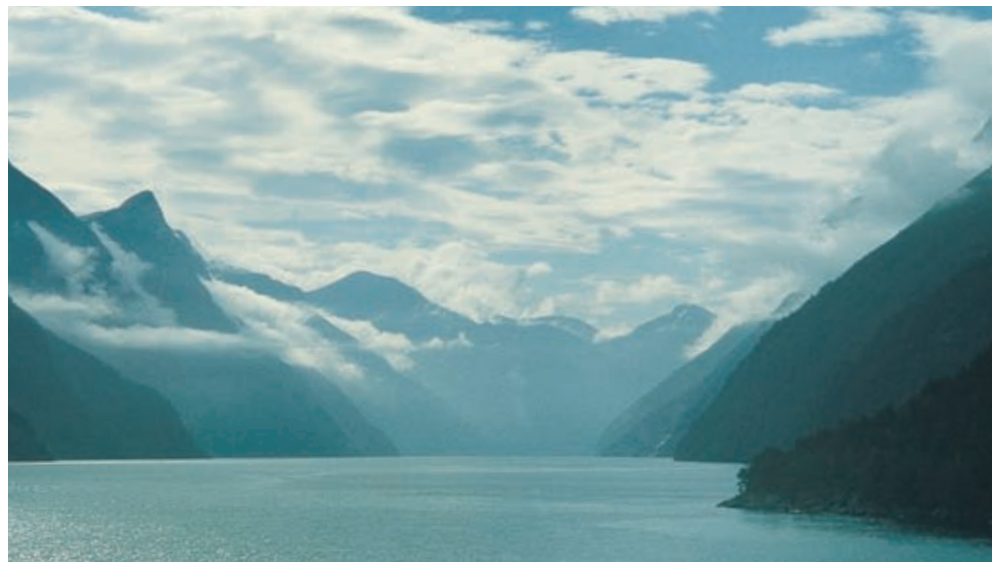
Montagne che si "tuffano" nel fiordo e, in alto, il ghiacciaio Svartisen.

Ho poi visitato Molde, simpatica cittadina ricca di fiori, che crescono da tutte le parti davanti a tutte le case, ornate da ricchi giardini nei quali le rose sono regine. Molde è chiamata del resto