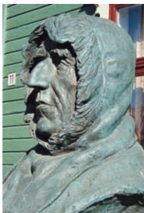
Monumento a Roald Amundsen.